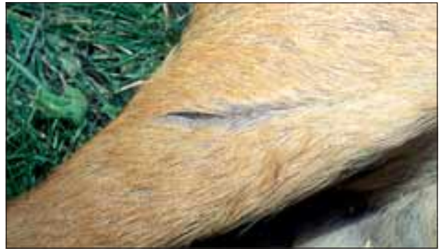
Abb. 20: Der Luchs setzt die scharfen Krallen nur zum Fangen, Niederziehen und Festhalten seiner Beutetiere ein. Dabei können manchmal charakteristische Kratzer und Löcher in der Haut der Beutetiere entstehen.