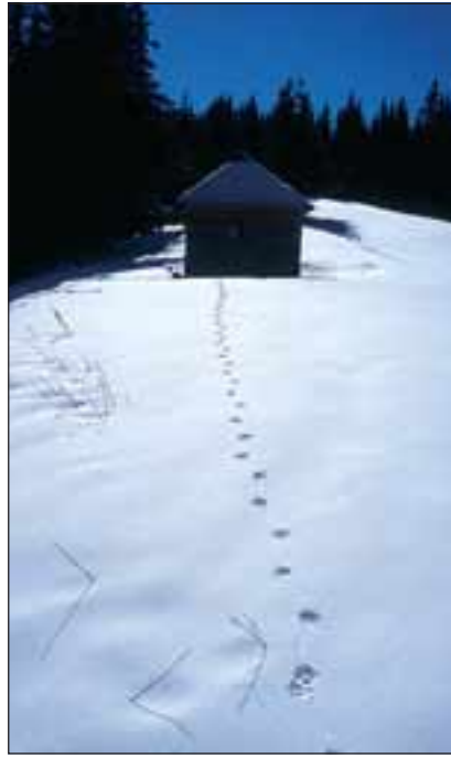
Abb. 15: Luchse gelten als ausgesprochen neugierig. Im Gebirge suchen sie nicht selten abgelegene Hütten auf. Diese können - wie im Bild - zum Absetzen von Harnmarken, aber auch als Unterschlupf oder Jagdhabitat (Kleinsäuger, Haustiere) dienen.

Lagerplätze werden vom Luchs vielfach südexponiert gewählt. Sie werden so angelegt, dass sie zwar in guter Deckung liegen, aber dennoch eine gute Übersicht bieten. Ein Lager ist am niedergedrückten Gras, Moos, Laub oder Schnee, allenfalls sogar als leicht ausgescharrte Mulde erkennbar. In Lagern des Luchses findet