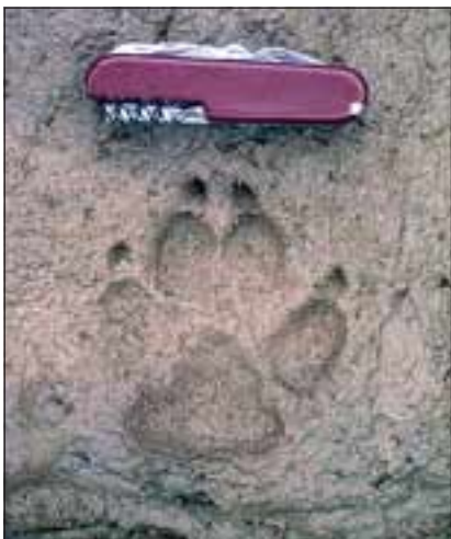
Abb. 10: Typisches Hundetrittsiegel: Die Zehen sind symmetrisch angeordnet, das heißt, die beiden inneren und die beiden äußeren Zehenballen sind jeweils gleich groß und befinden sich meist auf gleicher Höhe. Die kräftigen Krallen sind in der Regel breit abgedruckt.