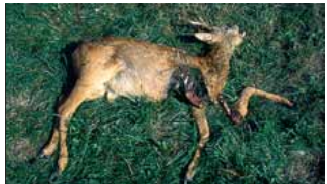
Abb. 24: ... gelegentlich auch an den Schultern oder am Hals angefrissen. In der Regel kehrt der Luchs so oft zu seinem Beutetier zurück, bis das gesamte Fleisch aufgefressen ist. Der Kadaver kann während einer Mahlzeit um einige Meter weggezogen werden.