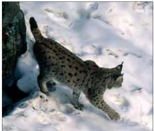
Abb. 18: Harnmarken werden als duftendes Verständigungsmittel in „Schnupperhöhe“ an markanten Punkten wie Wurzeltellern, Baumstümpfen, Felsen, Holzstößen etc. angebracht.