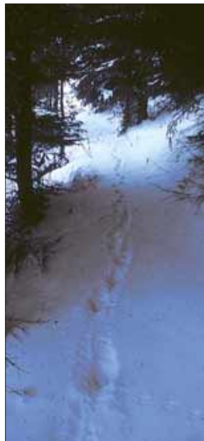
Abb. 13: In schwierigem Gelände legen Luchse häufig weite Strecken auf Forstwegen oder wenig befahrenen Straßen zurück. Selbst Brücken und Unterführungen können benutzt werden.