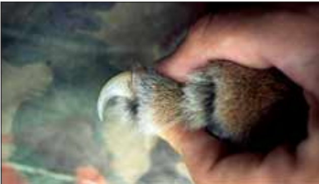
Abb. 21: Um eine Abnützung der Krallen zu verhindern, werden diese während der Fortbewegung in Hauttaschen zurückgezogen. Sie lassen sich wie bei der Hauskatze herausdrücken.