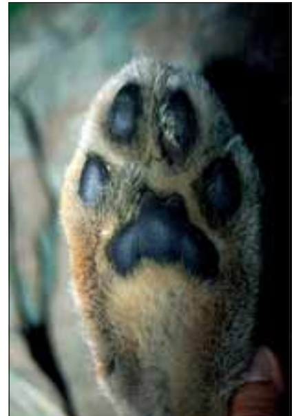
Abb. 2: Luchspfoten sind um die und zwischen den Ballen dicht behaart, was zu einer Spreizung der Zehenballen führt und das Einsinken in weichem Untergrund verringert („Schneeschuheffekt“). Die Trittsiegel können dadurch etwas „verwischt“ erscheinen.

Luchspfoten sind um die und zwischen den Ballen dicht behaart, was zu einer Spreizung der Zehenballen