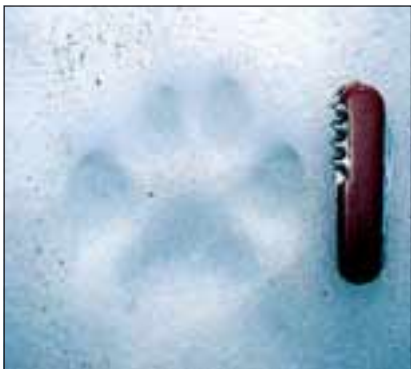
Abb. 11: Vorsicht bei der Bestimmung! Hundetrittsiegel zeigen nicht immer Krallenabdrücke und können daher in Form und Größe Luchstrittsiegeln gleichen. Stets mehrere Trittsiegel sowie den Fährtenverlauf und damit das Verhalten des Tieres genau studieren!

schen zwei aufeinanderfolgenden Abdrücken der gleichen Pfote, entsprechend den unterschiedlichen Rassen sehr stark.