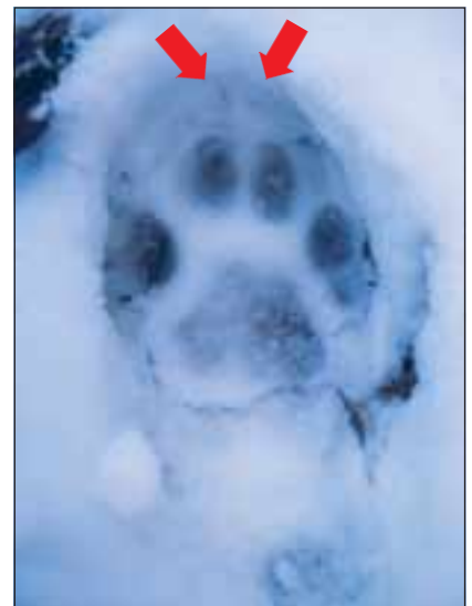
Abb. 3: Kommen die Krallen zum Beispiel in weichem Untergrund ausnahmsweise doch zum Vorschein, sind sie im Vergleich zu Hundekrallen fein, spitz und eher unauffällig (siehe Pfeile). Krallenabdrücke sind am häufigsten bei den beiden mittleren Zehen zu sehen.