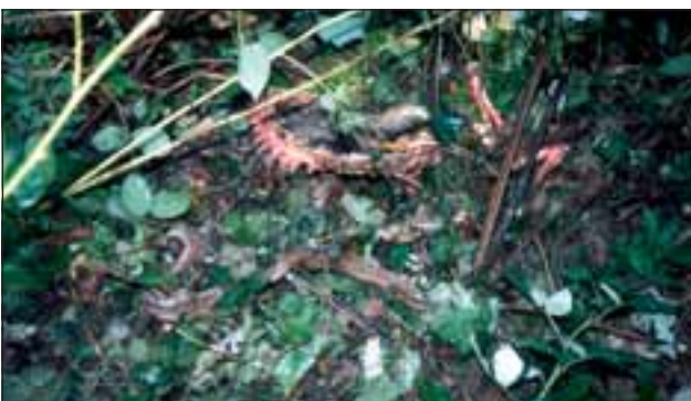
Abb. 25: Diese Bild zeigt die Reste eines Rehbockes, der im Verlauf mehrerer Nächte von einer Luchsin mit Jungen vollständig genutzt wurde. Übrig blieben lediglich der Kopf, die Haut, große Knochen und der Verdauungstrakt.