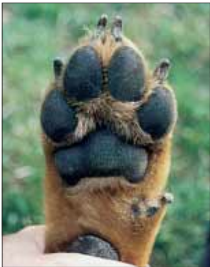
Abb. 9: Hundepfote: Die Krallen sind kräftig, stumpf und nicht einziehbar. Trittsiegelform, Trittsiegelgröße und Schrittlänge variieren entsprechend den unterschiedlichen Hunderassen stark.