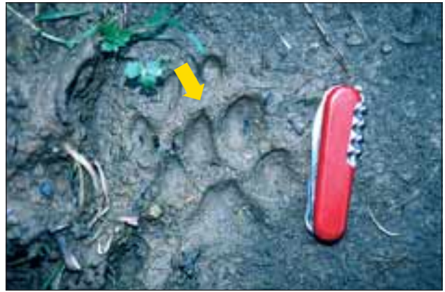
Abb. 5: Beim Gang und beim Trab (Schnüren) tritt der Hinterfuß meist etwas versetzt in den Vorderfußabdruck. Luchstrittsiegel sind etwa so groß wie eine in den Schnee gedrückte Faust (6 bis 9 cm).

führt und das Einsinken in weichem Untergrund verringert („Schneeschuh-effekt“). Die Trittsiegel können dadurch etwas „verwischt“ erscheinen.