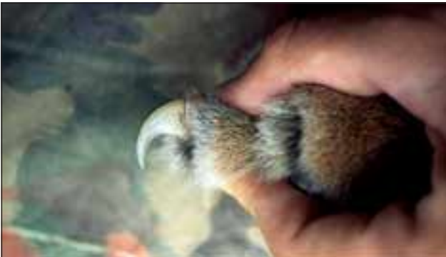
Abb. 21: Um eine Abnützung der Krallen zu verhindern, werden diese während der Fortbewegung in Hauttaschen zurückgezogen. Sie lassen sich wie bei der Hauskatze herausdrücken.