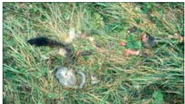
Abb. 26: Kleine Beutetiere wie Murmeltiere (Bild), Füchse oder Hasen werden gelegentlich durch einen Biss in den Kopf getötet. Auch hier bleiben oftmals ungenießbare Körperteile wie Kopf, Schwanz, Krallen und Verdauungstrakt übrig.