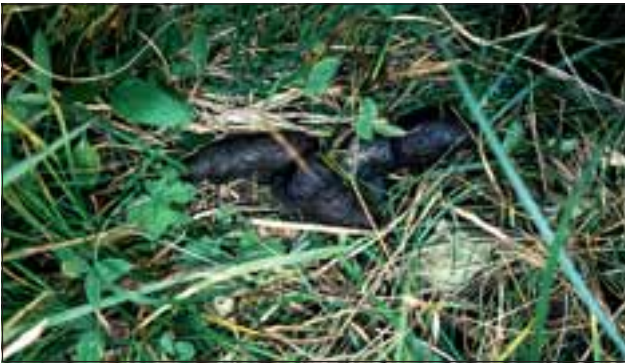
Abb. 19: Die meist verscharfte Luchslosung ist gut daumendick und besteht häufig aus 3 bis 6 einzelnen Losungsbällen, die etwa 3 bis 12 cm lang sind. Oft sind Wildhaare enthalten, kleine Knochensplitter, äußerst selten Pflanzen- oder Insektenreste.