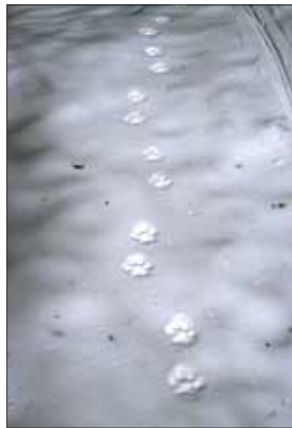
Abb. 7: Das Fährtenbild des Luchses kann je nach Geländebeschaffenheit und Bewegungsart variieren. Auf geeignetem Untergrund können Luchsfährten aber mit etwas Übung sicher erkannt werden.