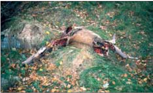
Abb. 27: Eine unvollständige Nutzung von Beutetieren (im Bild eine einjährige Hirschkuh) kommt vor allem bei Störungen sowie in der Anfangsphase einer Wiederbesiedlung vor. Werden solche Beutetiere liegen gelassen, kann der Luchs in Hungerperioden selbst Wochen später wieder zurückkehren.