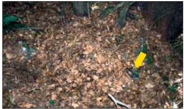
Abb. 28: Zum Konservieren der Beute und Abhalten von Aasfressern wird nach jeder Mahlzeit nach Möglichkeit die angefressene Stelle oder auch das ganze Beutetier mit Schnee, Laub, Erde etc. bedeckt. Von dieser Gämse ist nur mehr ein kurzes Stück des Laufes sichtbar (siehe Pfeil).

her störungsarme Gebiete wie felsige Schluchtwälder bevorzugt.