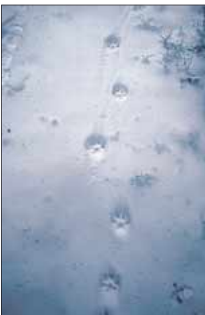
Abb. 6: Fährte eines schnürernden Luchses. Die Schrittlänge, also der Abstand zwischen aufeinanderfolgenden Abdrücken der gleichen Pfote, beträgt 80 bis 120 cm.

Verwechslungen kommen am ehesten mit Hundtrittsiegeln vor. Diese können rund oder länglich sein, sind aber in aller Regel symmetrisch. Die im Vergleich zum Luchs kräftigeren und stumpferen Krallen sind nicht einziehbar und daher auch im Trittsiegel meist abgebildet. Vor allem bei hartem Boden oder alten Trittsiegeln fehlen sie aber nicht selten, ebenso von Hunden mit stark behaarten Pfoten. Beim Hund schwanken die Größe der Trittsiegel und die Schrittlänge, also der Abstand zwi-