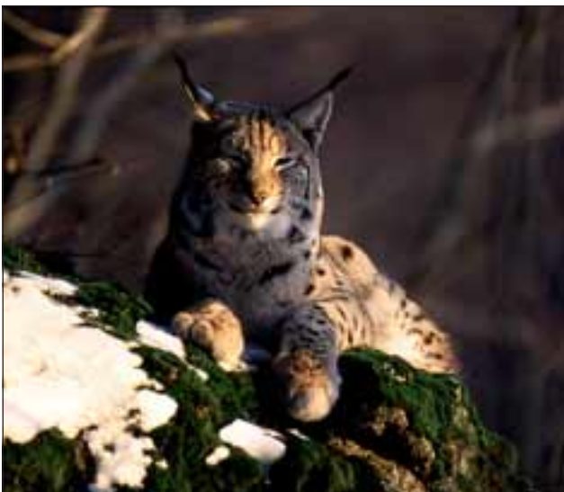
Abb. 17: Lagerplätze werden vom Luchs vielfach südexponiert gewählt und so angelegt, dass sie zwar in guter Deckung liegen, aber dennoch gute Übersicht bieten. Ein Luchs kann pro Tag mehrere Lagerplätze hinterlassen!

Der Luchs gräbt sich keinen Bau. Vielmehr nutzt er bereits vorhandene Unterschlupfe wie Felsüberhänge, trockene Stellen unter umgefallenen Bäumen, Höhlen unter einem Wurzelstock etc. als Kinderstube. Zur Jungenaufzucht werden unzugängliche und da-