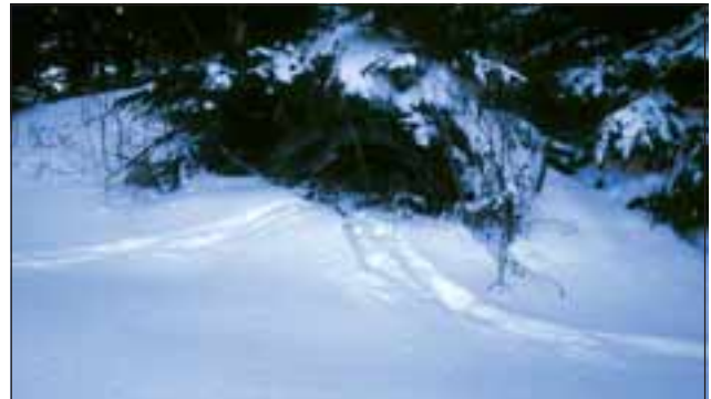
Abb. 22: Das Absetzen von Harnmarken ist auch aus dem Fährtenverlauf leicht ersichtlich. Während der Ranz wird oft alle hundert Meter markiert.