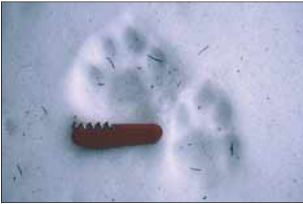
Abb. 4: Luchstrittsiegel sind in aller Regel asymmetrisch. Diese Asymmetrie ist bei den etwas kleineren und länglicheren Hinterpfoten ausgeprägter als bei den größeren und rundlicheren Vorderpfoten. Die Krallen zeichnen sich normalerweise nicht ab!