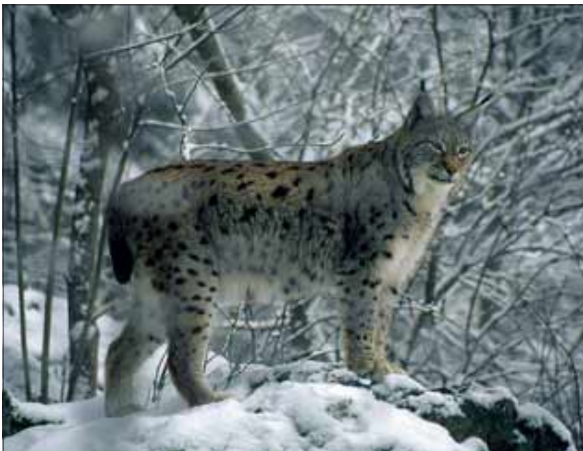
Abb. 1: Kennzeichen des Luchses: Ausgeprägte Hochbeinigkeit, kurzer Stummelschwanz mit schwarzer Endbinde, runder Kopf, Backenbart und schwarze Haarbüschel („Pinsel“) an den Ohren.

Abb. 2: Luchspfoten sind um die und zwischen den Ballen dicht behaart, was zu einer Spreizung der Zehenballen führt und das Einsinken in weichem Untergrund verringert („Schneeschuheffekt“). Die Trittsiegel können dadurch etwas „verwischt“ erscheinen.