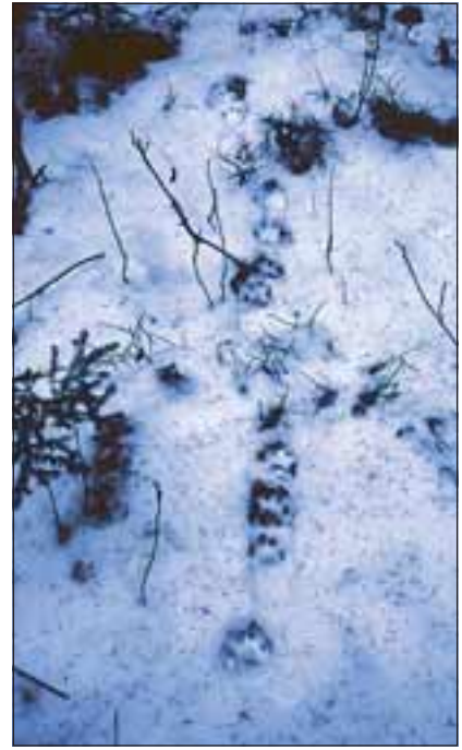
Abb. 16: Fährtenbild einer Luchsin mit einem Jungen. Jungtiere laufen direkt hinter der Mutter her und steigen oft in deren Trittsiegel. Man muss solche Fährten oft mehrere Hundert Meter verfolgen, ehe sie sich in Einzel-fährten aufteilen.

Bei der Abschätzung der Zahl der Tiere aus der Anzahl der aufgefundenen Lager ist Vorsicht geboten! Der Luchs verbringt die Tagesstunden großteils an einem ruhigen Ort, nützt die Zeit aber nicht nur zum Schlafen, sondern auch zur ausgiebigen Körperpflege. Dabei wird nicht selten der Liegeplatz geringfügig verlegt,