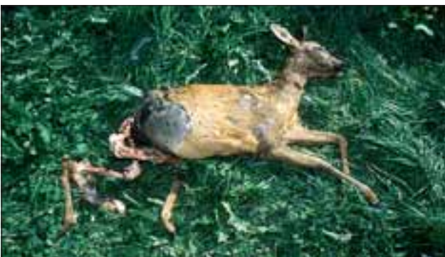
Abb. 23: Große Beutetiere werden durch einen Biss in die Kehle oder den Nacken getötet. Der Luchs hinterlässt kaum Kampfspuren in der Umgebung des „Tatortes“. Das Beutetier scheint äußerlich oft unverletzt. Huftiere werden meist an den Keulen, ...