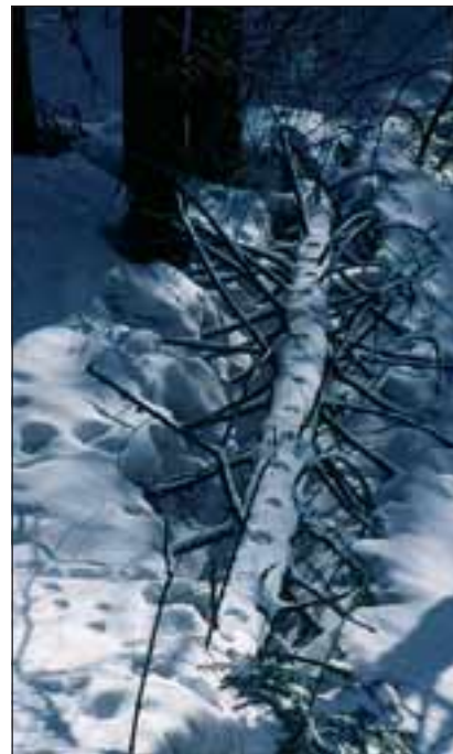
Abb. 12: Luchse sind sehr wendig und gute Kletterer: Ihre Fährten führen häufig über liegende oder schräge Baumstämme, Felsvorsprünge oder Steinmauern. Große Sätze und weite Sprünge, besonders wenn sie vertikal erfolgen, sind typisch für den Luchs.

Die „Jäger auf leisen Sohlen“ folgen gerne Linien, die im Gelände gut erkennbar sind, beispielsweise Forstwegen, Waldrändern, Bächen oder Bergrücken. So nutzen sie ein flexibles Netz von Wechseln mit markanten Punkten, die immer wieder aufgesucht und mit Harn markiert werden.