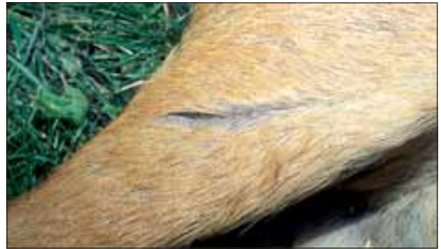
Abb. 20: Der Luchs setzt die scharfen Krallen nur zum Fangen, Niederziehen und Festhalten seiner Beutetiere ein. Dabei können manchmal charakteristische Kratzer und Löcher in der Haut der Beutetiere entstehen.