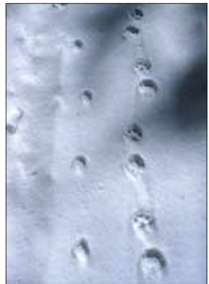
Abb. 8: Fuchstrittsiegel sind wesentlich kleiner als Luchstrittsiegel, zudem zeichnen sich die Krallen im Normalfall ab. Das Auseinanderhalten der Spuren vom Fuchs (links) und Luchs (rechts) sollte daher keine Probleme bereiten.