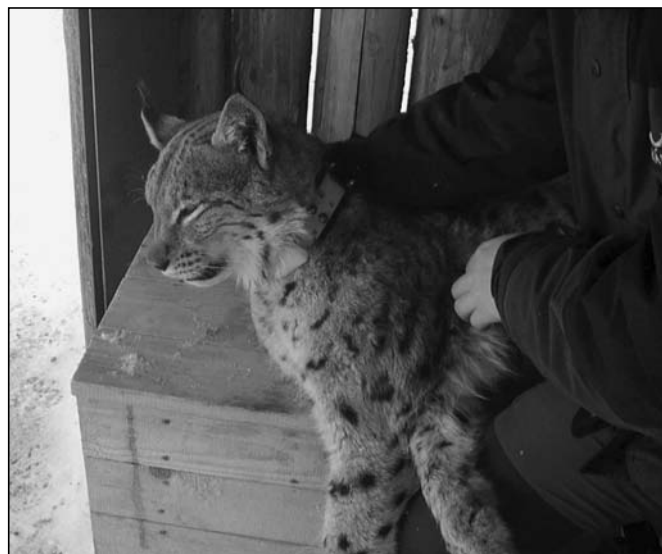
Abb. 2: Das Luchsmännchen Milan nach der Besenderung

Nach fast 50 Tagen am Sender konnten bereits sehr interessante Erkenntnisse zur Biologie des Luchses gewonnen werden. So legte Milan in 49 Tagen eine Strecke von 332 km zurück. Das entspricht im Durchschnitt 6,7 km je Tag. Das für diesen Zeitraum ermittelte Streifgebiet beträgt 34.525 (Minimum-Convex-Polygon) bzw. 18.028 ha (Kernel-Estimation 95 % Aufenthaltswahrscheinlichkeit).