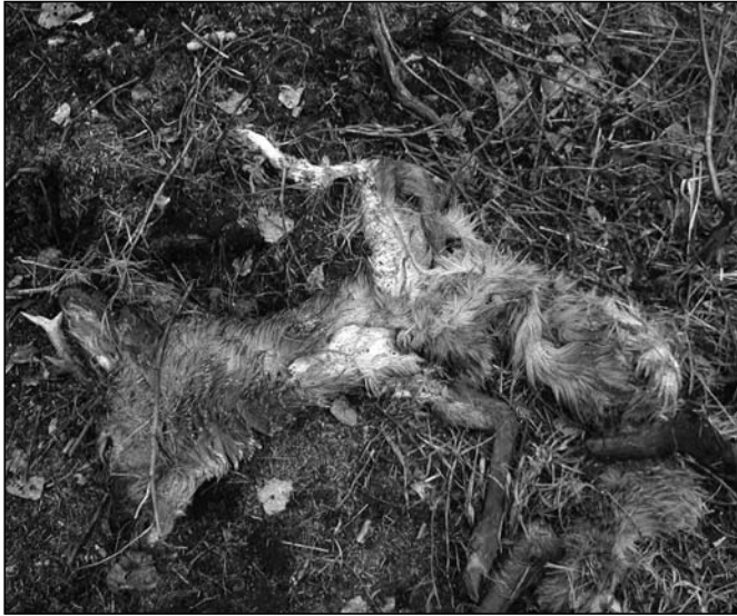
Abb. 4: Der Riss eines Luchses: Der Luchs bevorzugt als Nahrung das Muskelfleisch, Kopf und Fell bleiben übrig